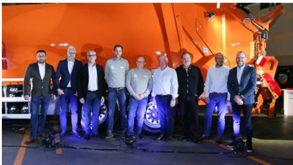
W uroczystości przekazania jubileuszowego pojazdu wzięli udział przedstawiciele przedsiębiorstwa komunalnego NordRen oraz firmy JOAB ze Szwecji. Gospodarzem wydarzenia był ZOELLER TECH reprezentowany przez zarząd oraz prokurentów spółki.

W fabryce ZOELLER TECH w Rekowiu Górnym wyprodukowano zabudowę nr 10.000. Jubileuszowy egzemplarz trafił do wyjątkowego klienta. Jest nim norweska firma NordRen, która dysponuje flotą ok. 200 pojazdów – wszystkie zostały skompletowane w polskiej fabryce.