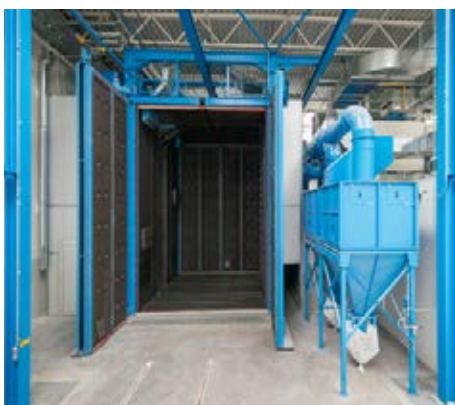
W nowoczesnej komorze śrutowniczej przygotowanie nawet tak dużego elementu, jakim jest skrzynia ładunkowa śmieciarki zajmuje tylko ok. 20 min.