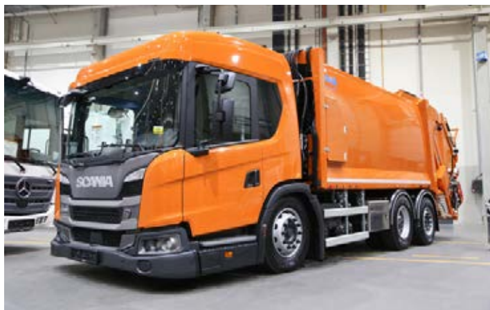
Jubileuszowa zabudowa została zamontowana na wyjątkowym podwoziu. Jest nim Scania L320 wyróżniająca się kabiną niskowejściową, a w egzemplarzu zamówionym przez NordRen – także funkcją przykłąku.

Jubileuszowy egzemplarz to śmieciarka 2-komorowa z tylnym załadunkiem, umożliwiająca zbieranie dwóch różnych frakcji odpadów podczas jednej trasy. Ma ona skrzynię ładunkową podzieloną pionowo w stosunku 65/35. Dzięki dwóm oddzielnym odwłokom, w których pracują dwie niezależne prasy zagęszczające, nie dochodzi do mieszania frakcji, co ma ogromne znaczenie zwłaszcza przy wyładunku odpadów. Zastosowane rozwiązanie gwarantuje wymierne korzyści zarówno pod względem ekonomicznym, jak i ekologicznym. Firma NordRen, która nabyła wyjątkową śmieciarkę, już na początku swojej działalności (2013 r.) postawiła na produkty marki JOAB projektowane i wytwarzane w Rekowiu Górnym.